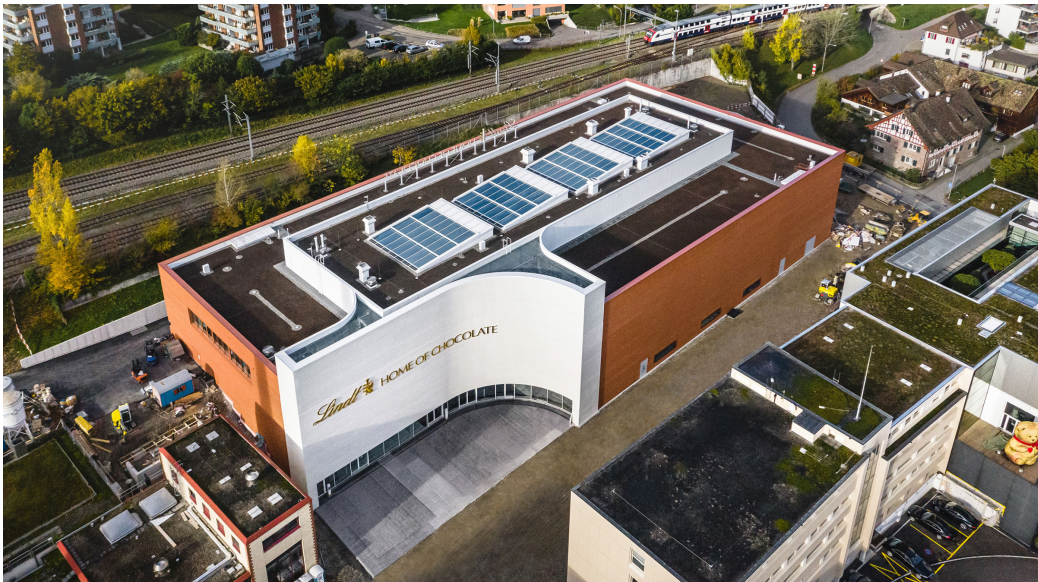
Bild „Drohnenaufnahme_Lindt Home of Chocolate_November.jpg“: Perfekt eingebettet in die bestehende Umgebung, bildet das moderne Design ein prägnantes Gegengewicht zum historischen Fabrikgebäude.

Alle Bilder abrufbar unter: http://media.pr.keystone-sda.ch/Lindt+Spruengli/Lindt+Home-of+Chocolate/Gebaeudeuebergabe+November+2019