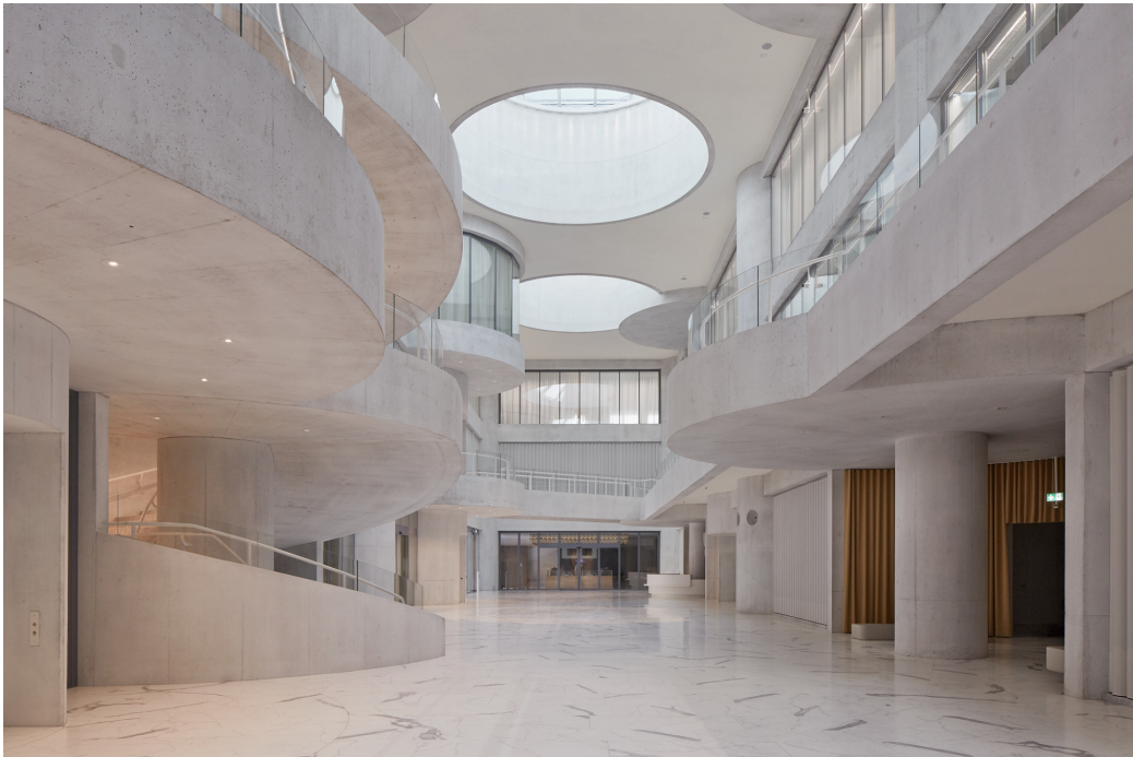
Bild „Innenansicht Lindt Home of Chocolate_November 2019.jpg“: Die runden Treppenaufgänge, Brückenpassagen und imposanten Oberlichter in der Decke verleihen dem Bauwerk besondere Eleganz.